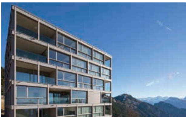
Rigi Kaltbad, Wohnung