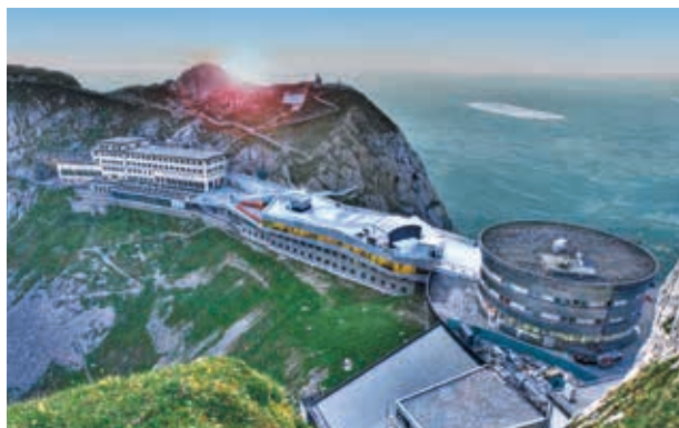
Pilatus, Hotel und Restaurant

Besuchen Sie uns in unserem Showroom oder unter www.hbtec.ch